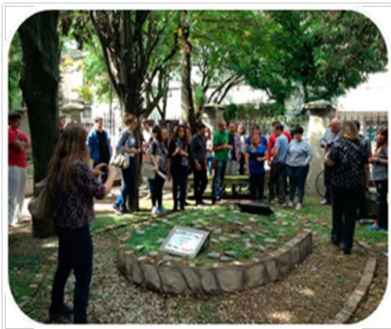
Imagen 1. Jardín de la Memoria