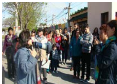
Momentos de la visita barrial con vecinos en el Día del Patrimonio.