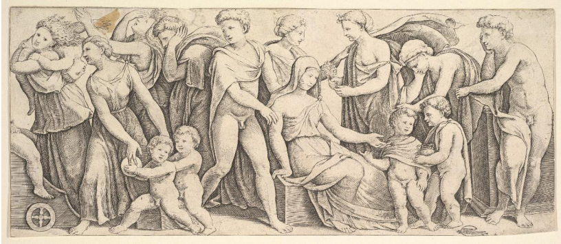
Grabado La boda de Jasón y Creúsa y la venganza de Medea de Maestro del Dado (1530-1560).

En comparación con el ejemplo anterior, este grabado parece tener una composición más sencilla, donde predominan las figuras humanas dispuestas en un fondo sin decoración. En esta obra se destaca la diferencia de los cabellos de Medea y Creúsa con los de las otras mujeres que los tienen recogidos, incluso con sus mismas versiones desdobladas de la parte derecha. La expresión de Medea al trasladar a su hijo muerto en el hombro esboza una tímida sonrisa. Solo aparece una parte del carro, sin las serpientes aladas que tirarían de él. Esta ausencia da mayor visibilidad a la pierna del niño muerto.