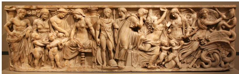
Antiguo sarcófago romano, c. 140-150 d. C.

Al comparar los grabados temprano modernos con los relieves antiguos, se observan diferencias. Nos detenemos en dos de ellas, asociadas a las figuras femeninas, dado que allí se concentra la carga dionisiaca de la imagen, es decir, la exteriorización de una emoción interior: el lugar dado a Creúsa y la huida de Medea.