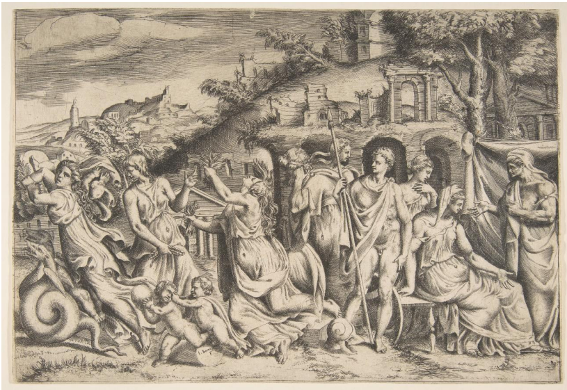
Grabado Jason y Medea de Giulio Bonasone (1531-1576).