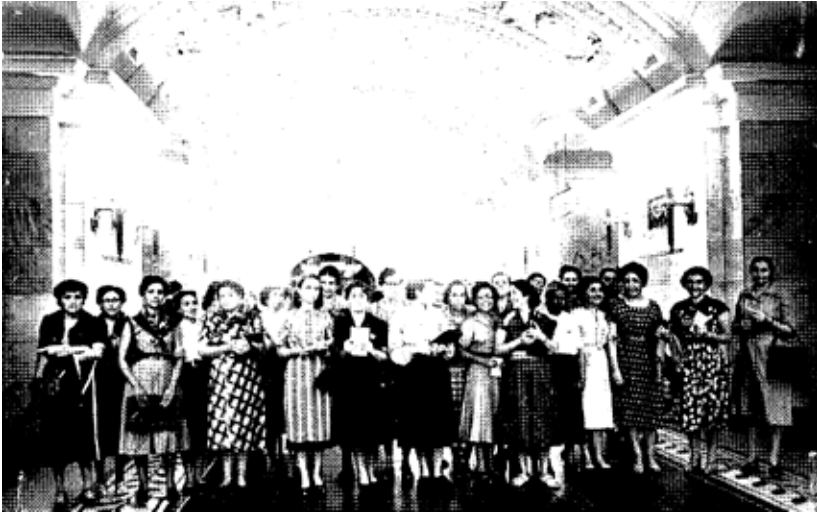
“Las delegadas visitaron el Metropolitano de Moscú. En la foto las delegadas en la estación Kaluzhskaya” 389 .

Estos ejemplos ilustrativos desde la fotografía se constituyeron como una herramienta de gran importancia que otorgaba a la policía la posibilidad de individualizar a las personas. En este caso, durante todo el legajo, solo se marcó a las dos militantes indicadas al principio. El recurso fotográfico fue históricamente un instrumento de detección “criminal” utilizado por la policía desde su conformación hasta la actualidad. Como se explicó en el capítulo I, estos métodos además de introducir la técnica en la “persecución del delito”, estuvieron atravesados por una impronta ideológica y criminológica que inducía a priori a determinar quiénes eran “peligroso/as” para la sociedad y en la dimensión política del delito quiénes perturbaban la identidad nacional 390 .