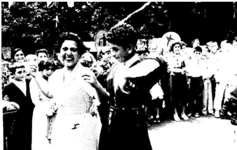
“Tbilisi, junio de 1953. La delegación asistió a un baile de máscaras celebrado en motivo de las vacaciones escolares. En la foto la delegada (1), xxxx” 388 .

El legajo en sí mismo se constituye como la prueba del arrebato y la discrecionalidad histórica que existió en este tipo de procedimientos que construían su propia legitimidad bajo argumentos inconsistentes, en el propio orden de lo legalmente establecido. La búsqueda de la presa política aparece en este documento como el hallazgo de la prueba sobre las prácticas del “elemento extremo”, que en una especie de álbum ilustrativo refleja sentidos adversos a los que las condenaron: