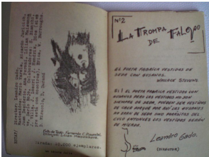
Fig 4. Interior de Trompa de Falopo N°2