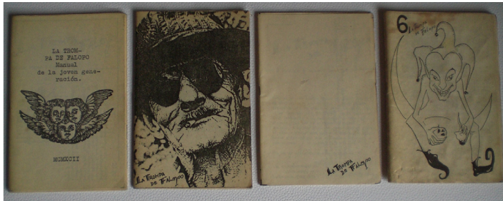
Fig 3. Cuatro de los seis ejemplares del fanzine Trompa de Falopo (1989-1993)