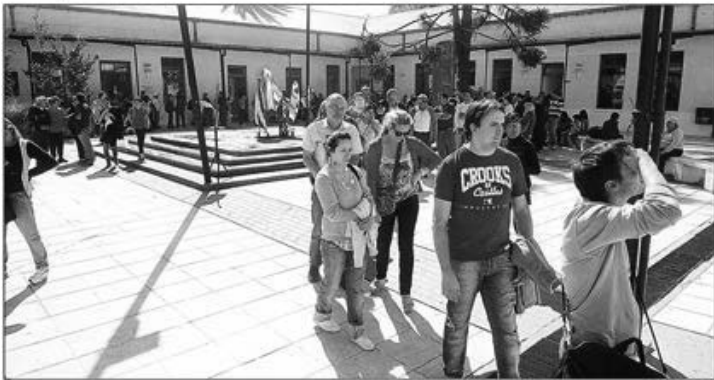
Largas colas, ayer a la mañana, en el Centro Ictas Malvinas, para conseguir los certificados de damnificados necesarios para obtener créditos y beneficios

Se registró ayer un crecimiento del retorno a las tareas habituales. Las escuelas tuvieron una mayor cantidad de alumnos y la Ciudad va recobrando su ritmo. Comenzaron a entregar certificados a los damnificados por la tormenta