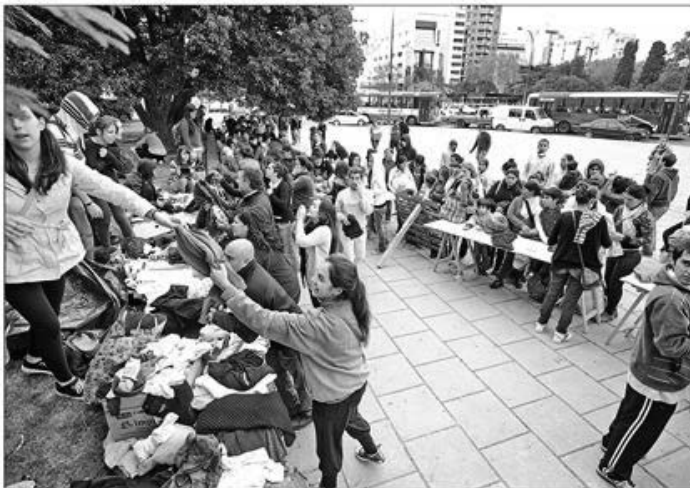
Plaza Moreno, frente a la Catedral, es uno de los lugares en los que se reciben donaciones (Foto). La ayuda de los platenses se reparte en las zonas más afectadas

Según el municipio, una de cada cuatro viviendas platenses fue directamente afectada por la inundación. Y las pérdidas globales ascenderían a 2.600 millones de pesos, según la estimación preliminar. Empieza la reconstrucción