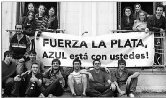
Estudiantes de Azul, uno de los tantos grupos que se movilizó espontáneamente para prestar ayuda en la Ciudad

El ausentismo todavía es muy alto. En las escuelas públicas llega al 40 por ciento. Buscan estimular el retorno de los chicos que sufrieron la inundación. Hay muchas instituciones que aún están en condiciones precarias por los daños