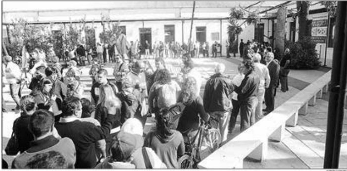
YA ENTREGARON 13 MIL CERTIFICADOS DE INUNDACION PARA TRAMITAR CREDITOS. - Largas colas hubo ayer, durante todo el día, para obtener certificados de inundación en la Plaza Malvinas. En el segundo día ya se entregaron 13 mil para la tramitación de créditos blandos destinados a reconstruir los hogares.