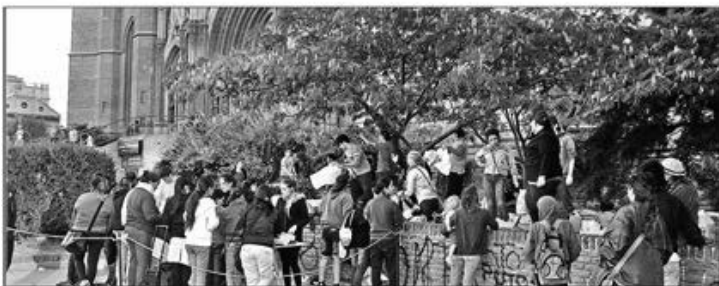
EL MOTOR DE LA SOLIDARIDAD NO SE FRENA. - Ya pasaron diez días del desastre y la Ciudad intenta retomar la normalidad. Pero el motor de la ayuda solidaria sigue funcionando y las donaciones frente a la Catedral no se detienen, como lo refleja esta foto tomada ayer al mediodía.