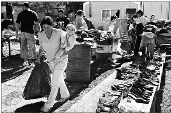
La distribución de mercadería a las víctimas de la inundación genera reclamos en algunos barrios, que plantean que no les llega lo que necesitan