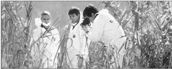
Agentes de Policía Científica en un cafetalal de 134 y 69, donde ayer encontraron el cuerpo de la vecina que estaba desaparecida

Para el juez Arias son 54. Pero el fiscal que lleva adelante la investigación dice que hasta ahora sólo están constatados 52 fallecimientos. El último es el de la mujer que estaba desaparecida desde el martes en Los Hornos