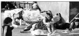
Angustia después del miedo en los centros de evacuación

En minutos, las calles fueron ríos y en las casas había más de 1 metro de agua